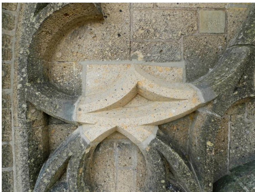
Restauratie van tufstenen blindtracering. Het aangetaste blok met toot is vervangen door een andere tufsteen. Omdat hier een element als geheel is vervangen, spreekt men in het kader van deze URL over 'Vernieuwen' en niet 'Repareren'. (In dit geval categorie 3b: 'Imiteren'.)