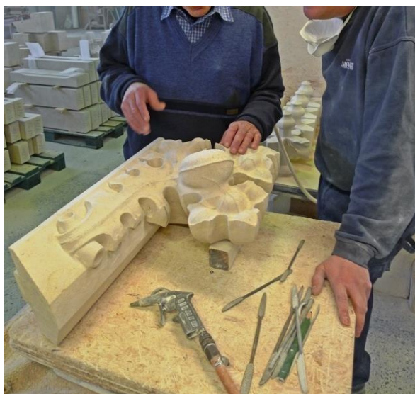
Beeldhouwwerk wordt doorgeleid naar een deskundige uitvoerder. Een aantal toetsmomenten bij de uitvoering ervan waarborgt de kwaliteit.