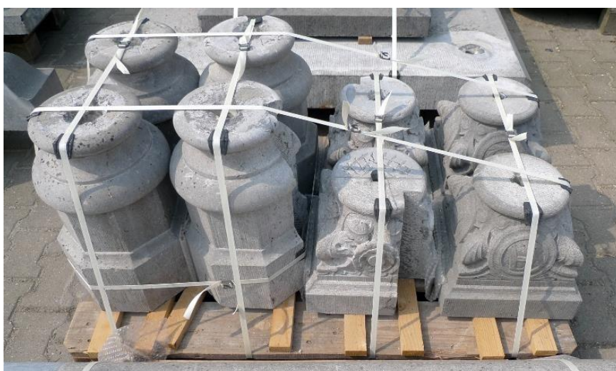
Gerestaureerde elementen van een hardstenen zuilengalerij staan klaar voor veilig en schadevrij transport naar het werk.

Genoemde werkzaamheden dienen te voldoen aan de bestekstermen zoals omschreven in Bijlage 4.