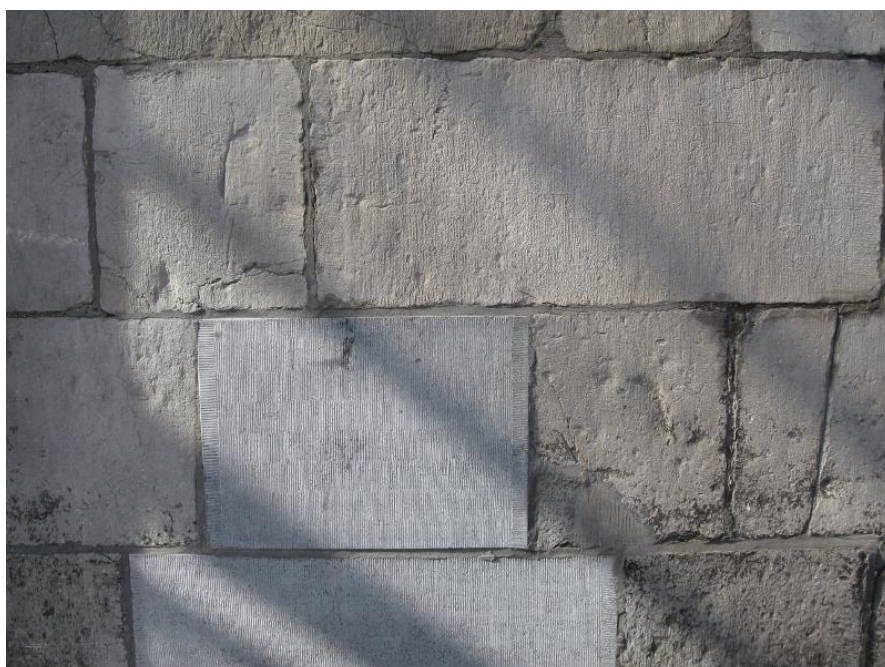
De oude blokken Naamse steen aan deze gevel zijn eerst met de hand vlak gemaakt en daarna pas gefrijnd. Recente vervangingen met lisse steen (midden en middenonder) zijn vlak gezaagd en daarna gefrijnd. Het eindresultaat sluit niet goed aan bij de oorspronkelijke omgeving, omdat het de onvolkomenheden van het handwerk mist en het materiaal anders is. Een voorbeeld van 'Imiteren'.